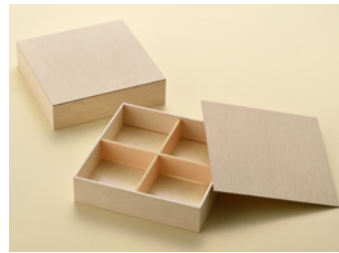
AF6.5 寸角 W PS 十字仕切付 共紙蓋