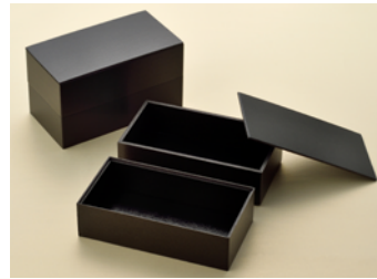
KU 黒紐 50 長折小 2段 共面取蓋