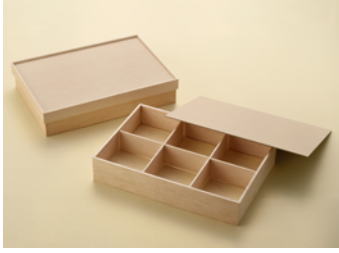
AF90-60 懐石箱 6仕切付 カブセ蓋 AF90-60 懐石箱 6仕切付 F20ノセ蓋