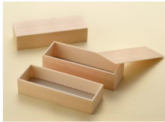
関東杉 巻一本 共面取蓋 関東杉 巻一本(深) 共面取蓋