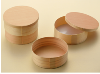
ワッパ 50号2段(レンジ不可) 赤松(国産)