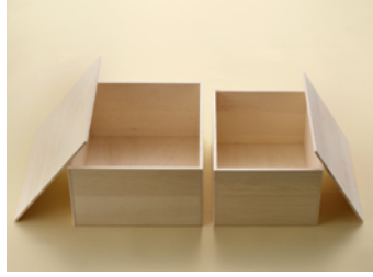
AF 木箱一房用 AF 木箱 1Kg用