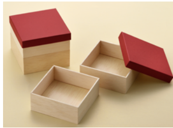
AF4寸 1段 紙ノセ蓋 AF4寸 2段 紙ノセ蓋