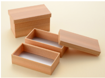
多聞杉長折 2段 小 共面取蓋 多聞杉長折 2段 小 共カブセ蓋