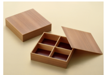
多聞杉 6.5 寸 共面取蓋