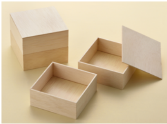
AF4寸 角1段 F面取共蓋 AF4寸 角2段 F面取共蓋