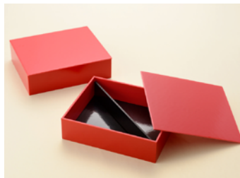
ランチボックス RED/ 仕切付 共面取蓋