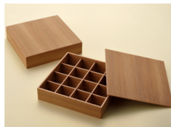
日吉杉 5mm8 寸 共面取蓋