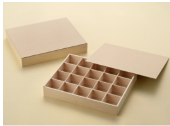
AF20 仕切折 フィルム張 無地紙蓋