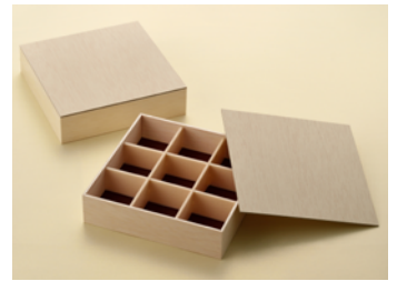
AF6.5 寸角 W PS 点心仕切付 共紙蓋