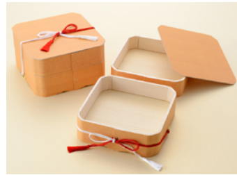
6寸ハリ下折 紅白・紫白房付 紙ノセ蓋 6寸ハリ2段折 紅白・紫白房付 紙ノセ蓋 6寸ハリ3段折 紅白・紫白房付 紙ノセ蓋