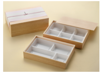
関東杉 90×60 1段 会席折 共面取蓋 関東杉 90×60 2段 会席折 共面取蓋