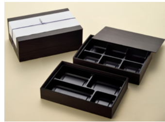
黒久松 90×60 1段 会席折 共面取蓋 黒久松 90×60 2段 会席折 共面取蓋