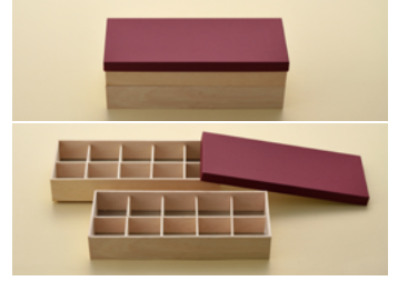
別注2段 紙カブセ蓋