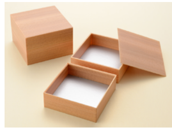
多聞杉角折 2段 共面取蓋