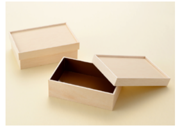
AF 上うな重折 カブセ蓋 耐水紙付 AF 上ちらし カブセ蓋 耐水紙無