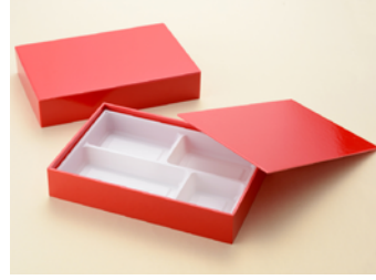
90-60RED 中トレー W付 共面取蓋