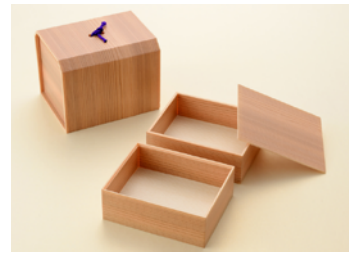
鎌倉 2段折 共面取蓋