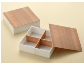
白エンボス 6.5 寸折十字仕切付 (茶) 杉面取蓋