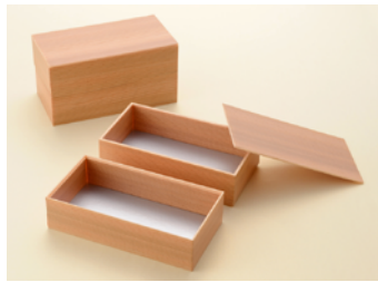
多聞杉長折 2段 大 共面取蓋 多聞杉長折 2段 大 共カブセ蓋