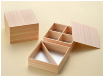
美山松 3.5mm 4.8寸 角2段 6×24 120