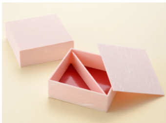
雲竜薄桜 5 寸角 / 仕切付 共面取蓋