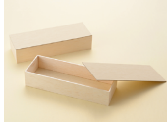
AF60 長折(鯖折) F#20 紙ノセ蓋 1段