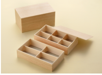
関東杉長折 特大 共面取蓋