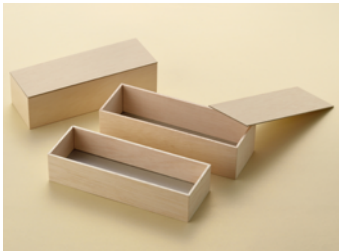
AF 巻一本 無地紙蓋 AF 巻一本(深) 無地紙蓋