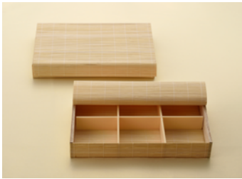
新スタレ 御膳折 白 90-60