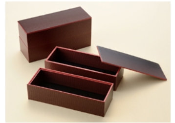
寝床折 2段 共面取蓋