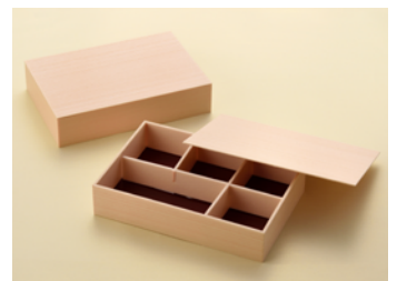
赤杉 彩弁当 1 段 共面取蓋