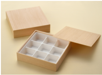
関東杉 7寸 9仕切トレー付 弁当箱 共面取蓋