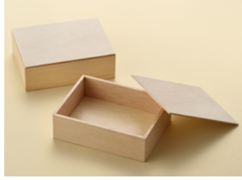
AF1 合ミニ折 共面取蓋