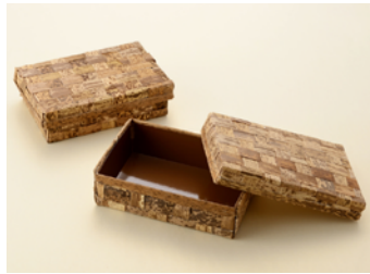
竹皮 BOX TX-6H 耐水紙付 竹皮 BOX TX-6H 耐水紙無