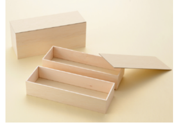
AF60 長折 2段ゲタ付 F#20 紙ノセ蓋 2段