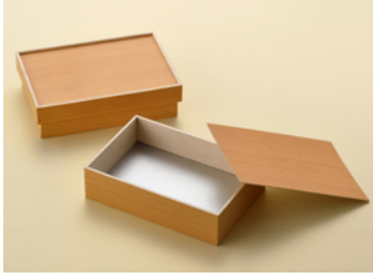
AF1 人折 カブセ蓋 AF1 人折 紙ノセ蓋