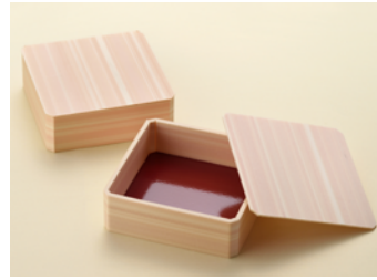
美山桧 50 縁高折 5 寸 共面取蓋