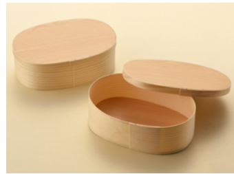
ワッパ 小判2号(レンジ)赤松(国産)