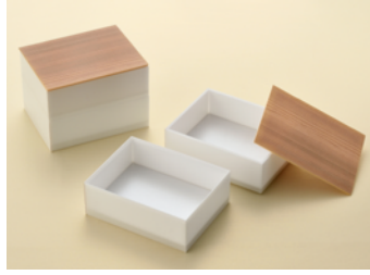
白エンボス2段 杉面取蓋