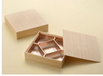
関東杉 7寸 共面取蓋