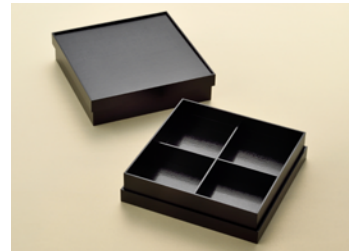
縁高松花堂(小)十字仕切付