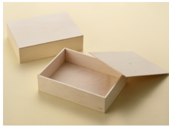
AF ギフト箱 大深 共面取蓋