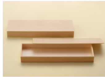
鰻蒲焼 1本折 共面取蓋