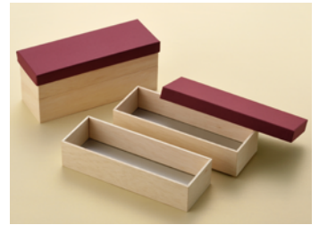
AF 寝床折 2段 紙カブセ蓋