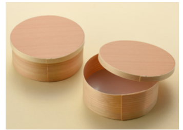
ワッパ 50号(レンジ)赤松(国産)