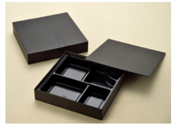
黒久松 8.5寸角 共面取蓋