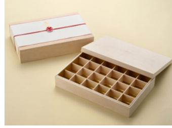
AF24 仕切 金数 印籠蓋