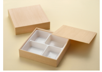
関東杉 7寸 4仕切トレー付 弁当箱 共面取蓋