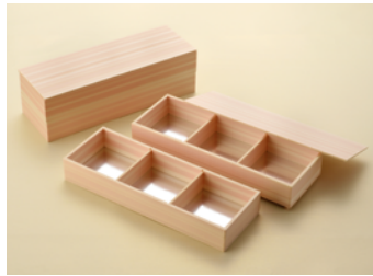
美山松 5mm 長手膳 3マス1段 共面取蓋 美山松 5mm 長手膳 3マス2段 共面取蓋