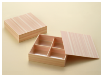
美山桧 7 寸 共面取蓋