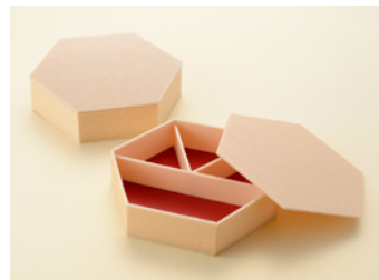
関東杉六角折 大 3 仕切付 共ノセ蓋