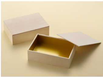
AF 一半深金内装付折 共面取蓋