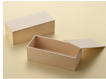
AF 上太巻箱 共面取蓋