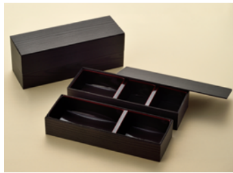
黒久松 90×30 1段 共面取蓋 黒久松 90×30 2段 共面取蓋