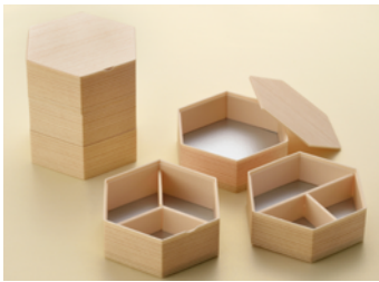
関東杉六角 2段 落蓋 関東杉六角 3段 落蓋