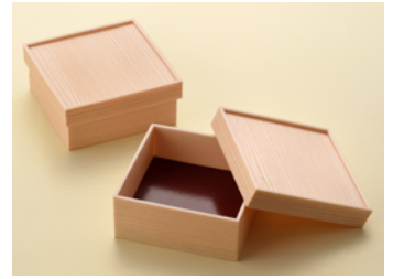
関東杉 4.3 寸 共カブセ蓋