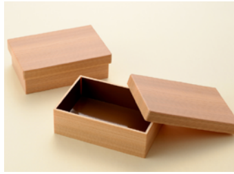
多聞杉うな重 共カブセ蓋 耐水紙付 多聞杉ちらし 共カブセ蓋 耐水紙無