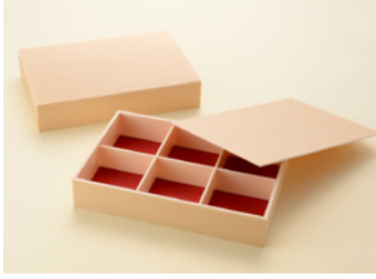
関東杉 90-60 共面取蓋(銀底あり)